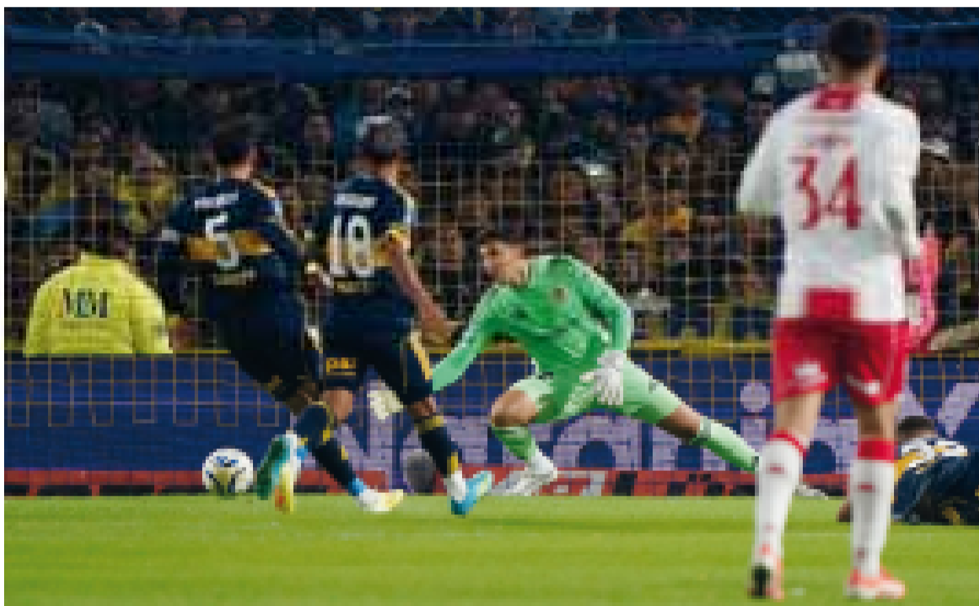
El Huracán venció a Boca Juniors por goles a uno en el partido de ida de la Copa Libertadores.

Alrededor de la mesa se sentaron representantes de los estudiantes, docentes y personal de los hospitales universitarios de la provincia de Córdoba para presentar propuestas concretas. Página 2