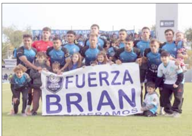
Este es el once inicial que salió frente a Ferro, hace una semana. Hoy habrá modificaciones en el conjunto titular del Celeste ante Chaco For Ever.

Del otro lado estará Chaco For Ever, que tampoco atraviesa un presente sencillo. El equipo chaqueño viene de caer ante Almirante Brown y necesi-