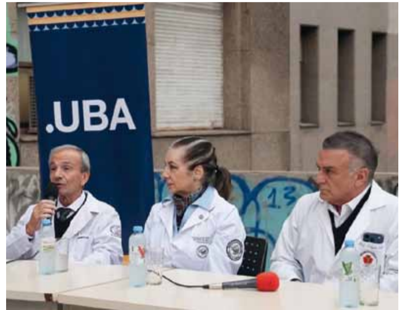
Reclamo. Los directores de los hospitales universitarios denunciaron que en 45 días podrían dejar de funcionar si no se revierte la situación.