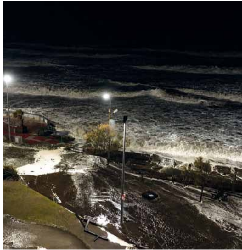
Temporal. El mar embravecido se "tragó" la costanera en Monte Hermoso.

También se reportó la caída de ramas de gran tamaño en distintos sectores, como en la avenida Pinolandia y en la zona de calles 556 y 513, además de otros puntos distribuidos en ambas localidades. Además, hubo voladuras de