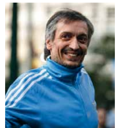
Recuperación. El dirigente deberá continuar con "seguimiento y controles ambulatorios".

El diputado dijo que, si bien le hubiera gustado que su madre estuviera acompañándolo, él le sugirió "especialmente que no lo haga", alegando que "ella no merece el show que montarían con su traslado si le concedieran el permiso". - DIB -