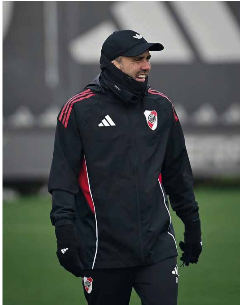
Enfocado. "Chacho" debe convencer desde el juego.

mitieron conservar el séptimo puesto del Grupo A y avanzar a la fase eliminatoria.