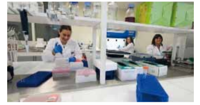
El objetivo es que "nuestros científicos no tengan que irse".

La oposición impulsa un proyecto en la Legislatura bonaerense para un polo de desarrollo de biotecnología, que tiene el objetivo de "convertir a la Provincia de Buenos Aires en el gran motor científico y tecnológico de la Argentina y de América Latina".