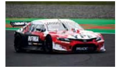
El Toyota Camry dominó la pista.

Matías Rossi consiguió la pole position en la quinta fecha del Turismo Carretera, disputada en el circuito de Termas de Río Hondo, y reafirmó su dominio histórico en las clasificaciones de la categoría más popular del automovilismo argentino.