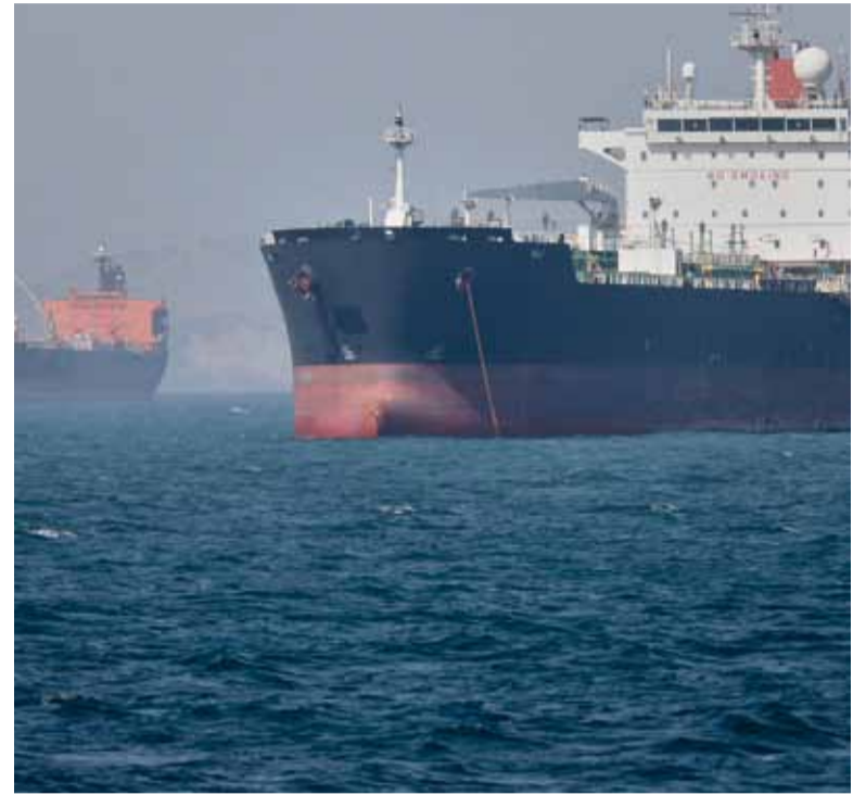
Queja. Teherán denunció una violación del alto el fuego y respondió con una ofensiva contra destructores norteamericanos.

Según la versión oficial, los detenidos integraban una organización asociada a la doctrina