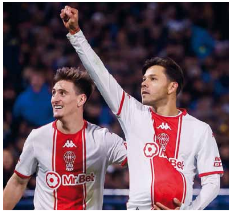
Adentro. Romero marcó por duplicado para el Globo.

En el complemento bajó el ritmo. Boca volvió a inquietar recién a los 15', con un centro de Aranda que Giménez estrelló en el palo.