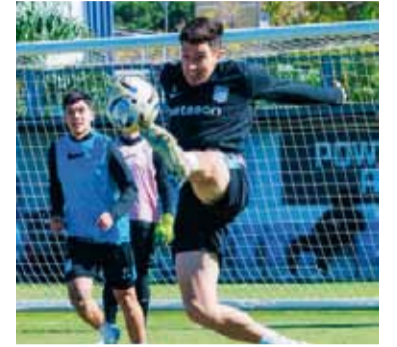
Se jugará con dientes apretados.

Racing Club de Avellaneda enfrenta a Estudiantes de La Plata desde las 17 en el estadio Jorge Luis Hirschi, por los octavos de final del Torneo Apertura. El árbitro del encuentro será Sebastián Martínez, mientras que José Carreras estará a cargo del VAR.