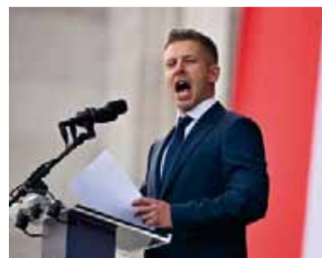
Magyar aseguró que habrá un cambio de sistema.

de Tisza "será el Gobierno de todos los húngaros", y enfatizó la inclusión y dignidad igualitaria para todos los ciudadanos.