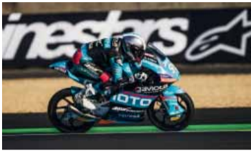
Gran clasificación de "El Gladiador".