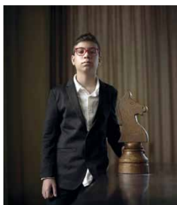
Oro. Historia del ajedrez.

La última partida tendrá además un atractivo especial: enfrentará desde las 4.30 al ruso Ian Nepomniachtchi, excandidato al